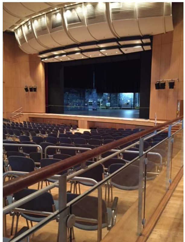
(Blick von der rechten Seite)