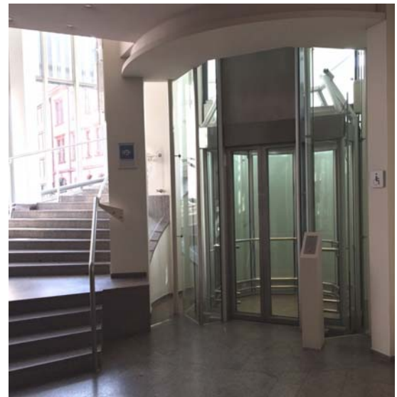
(Aufzug zum Kirchner Saal)