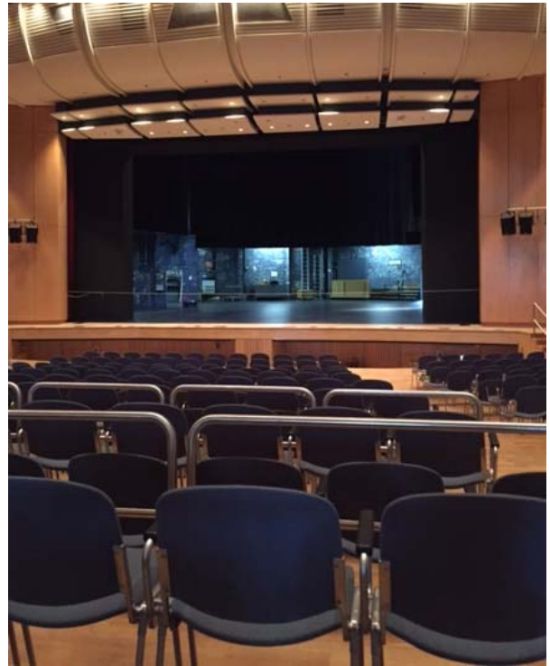
(Blick von Reihe 17 rechts)