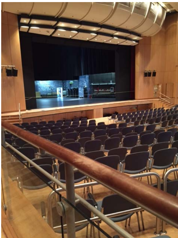
(Blick von der linken Seite)