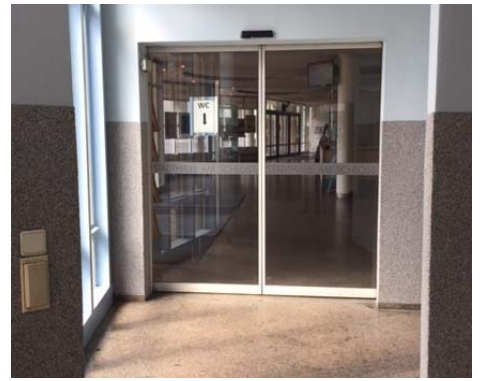
(Automatiktür in die Stadthalle)