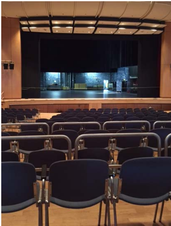
(Blick von Reihe 17 links)