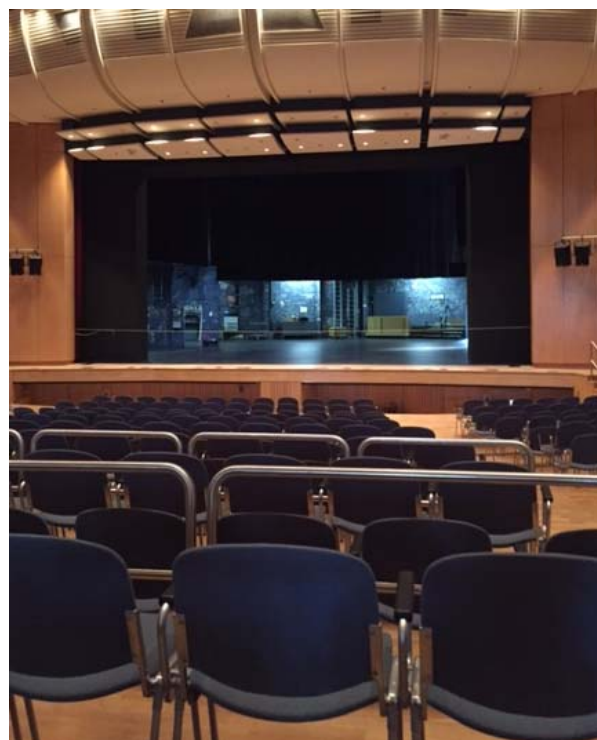
(Blick von Reihe 17 rechts)