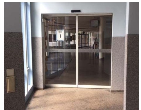
(Automattür in die Stadthalle)