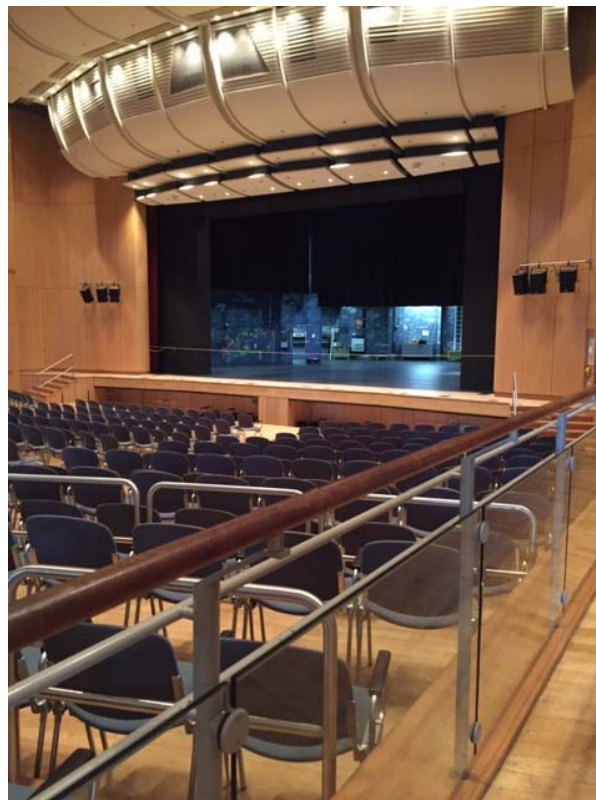
(Blick von der rechten Seite)