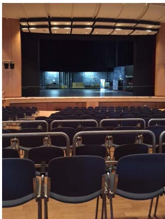
(Blick von Reihe 17 links)